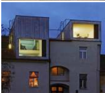
foto 5: Rodinný dům v Nýanech (autor: Kryštof Štulc - Atelier..., Praha)

foto 4: Rodinný dům v Blatné (autor: Osamu Okamura)