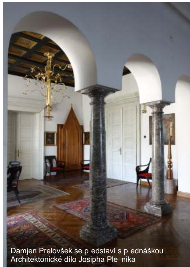
Damjen Prelovšek se představí s přednáškou Architektonické dílo Josipa Plešnika

Výstava chce připomenout poněkud pozapomenuté dílo architekta Jana Kotrovy. Při stavbě tvrdil pro železniční zastávku uplatnil Kotrova jako první v dějinách myšlenku architektury zahradního města. Čerpal ze svých znalostí německých a anglických zahradních měst. Jeho cílem bylo vybudovat samostatné město ve městě, spojení výhod venkovského města v jeden celek.