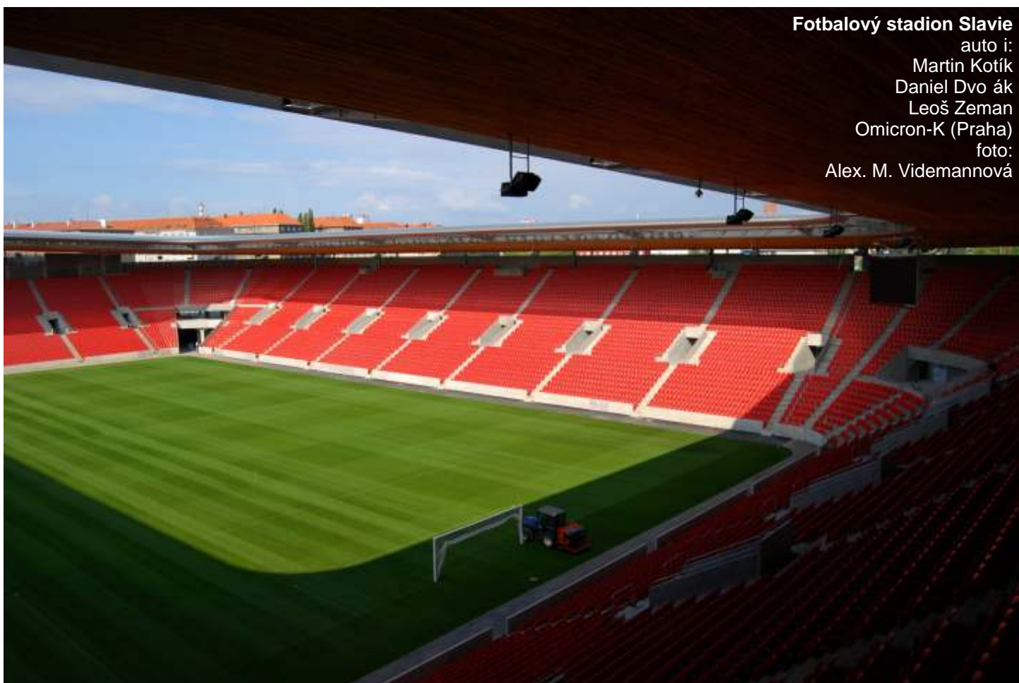
Fotbalový stadion Slavie